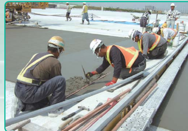
目地入れ作業 コンクリートに目地を入れていく。人の手による入念な作業も必要とされます。