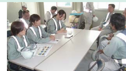
羽田空港の施工現場で、担当者から話を聞くCSR報告書制作チーム。

大成ロテックは、道路だけでなくほかにも様々な工事に参加しています。CSR報告書制作チームは、羽田空港の滑走路・エプロン新設工事の現場を訪れ、現場で密着取材しました。これほど大規模な工事もやっているんだ、と正直驚くばかりでした。