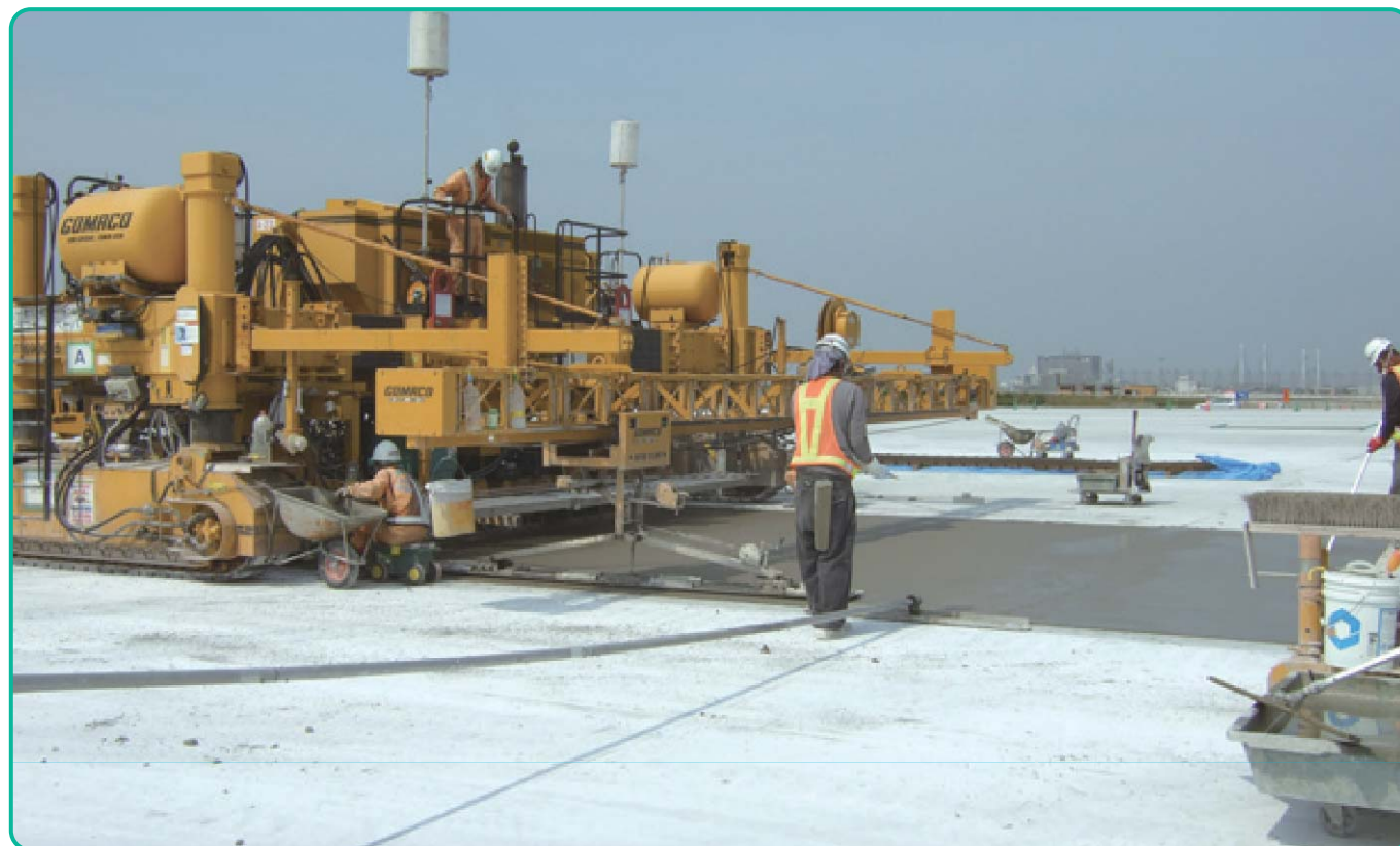
スリップフォームによるコンクリート施工状況 コンクリートの供給から敷きならし、締固め、成型、表面仕上げなどを完全機械化したスリップフォーム方式により、1時間あたり120立米ものコンクリートを打ち込むことができます。これにより、省力化やコストダウンを実現し、ことに空港など層の厚い大規模コンクリート舗装で威力を発揮しています。