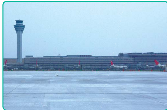
当社の担当している新しい国際線地区エプロン建設現場。

東京の空の玄関口、羽田空港。1日に20万人もの人々が利用されると言われます。現在、2010年の完成を目指して、滑走路、国際線ターミナル、新管制塔などの拡張工事が着々と進んでいます。大成ロテックの技術は、こんなところでも活躍しています。