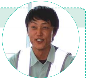
入社して最初の現場がいきなり羽田の巨大プロジェクトだったという多野工事担当。やりがいとともに大きな責任を感じている毎日だと語る。