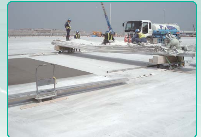
コンクリート養生 流し込んだコンクリートの上に養生マットを敷き、散水して乾燥を防ぎ、時間をかけて養生を行います。養生とは、コンクリートが硬化するまでの間に適度の温度と湿度を保ち、十分な強度を確保する大切な工程です。