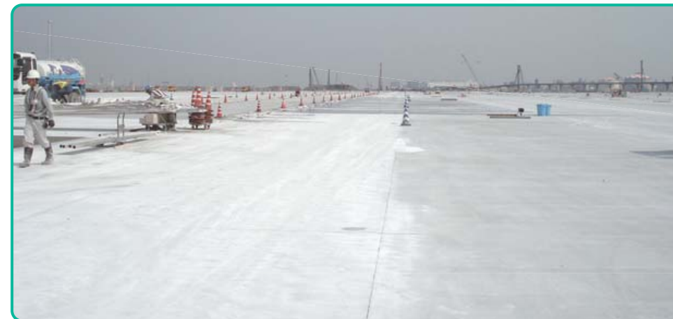
コンクリート舗装完了 遙か先まで延々と続くエプロン建設現場。規模の大きさがよく分かります。

Corporate Social Responsibility Report 2009