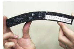
リラクスファルト舗装