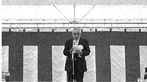
竣工式典 大成ロテック株式会社 石岡合材工場事務所

今回のリニューアル工事は、同社が重要課題として推進している働き方改革における職場環境改善の一環として行われたもの。敷地内には景観や環境に配慮した舗装モデルを設置して、一般の人も見学や体験ができるようにしたほか、外壁には石岡市の公認キャラクターを描き地域と密着した