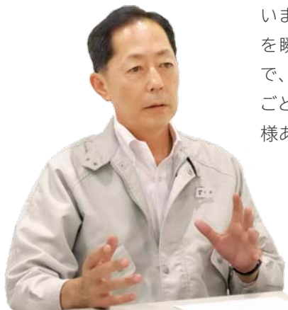
城南島リサイクルセンター 工場長

これから増えると予想される五輪需要に向けて対応できる体制は整えています。青海工場と連携して、お客様のニーズに臨機応変に対応できる工場にしていきたいです。