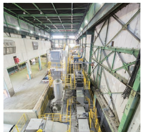
城南島リサイクルセンター

当社の中間処理工場では法令遵守のもと、環境に配慮した工場設備により再生率ほぼ100%を達成しました。2018年10月には、道路業界初の再生砕石「東京ブランド“粋な”えこ石」の施設認証を取得するなど、持続可能な循環型社会の形成の一助となるべく、これからも環境負荷の低減に取り組んでいきます。