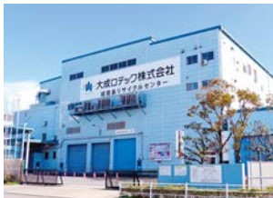
城南島リサイクルセンター 主にコンクリート廃材の中間処理を行っています。

大成ロテックは、道路などの施工や合材製造、営業活動、技術開発・研究活動、オフィス活動その他の日常業務を通じて、右図のような環境負荷物質を排出しています。そして、舗装工事現場から排出されるアスファルト、コンクリートの廃材などを再生する中間処理プラントの活用により、産業廃棄物最終処分量の削減に貢献しています。