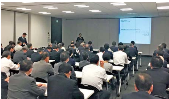
コンプライアンス研修の様子

また、今年度は昨年度に引き続き、「法務コンプライアンス部」および「監査部」を中心に、一連の独占禁止法違反事件を受けて策定した再発防止策に関するフォローを重点的にを行い、関係各部門と連携することにより、再発防止策のさらなる徹底を図っています。