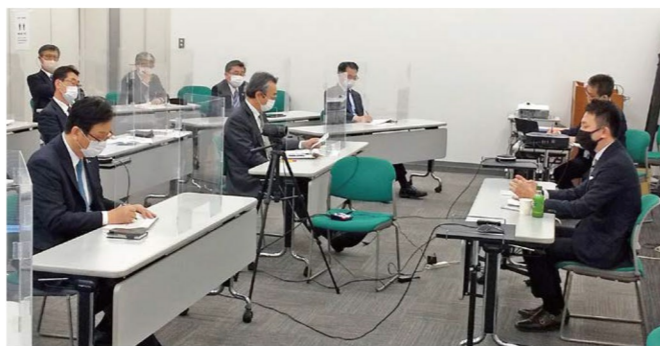
コンプライアンス研修の様子

また、今年度は昨年度に引き続き、「法務コンプライアンス部」および「監査部」を中心に、一連の独占禁止法違反事件を受けて策定した再発防止策に関するフォローを重点的に行い、関係各部門と連携することにより、再発防止策のさらなる徹底を図っています。