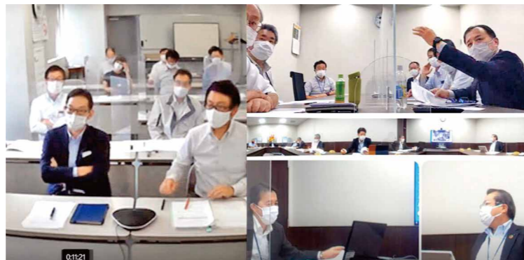
コンプライアンス研修の様子

また、今年度は昨年度に引き続き、「法務コンプライアンス部」および「監査部」を中心に、一連の独占禁止法違反事件を受けて策定した再発防止策に関するフォローを重点的に行い、関係各部門と連携することにより、再発防止策のさらなる徹底を図っています。