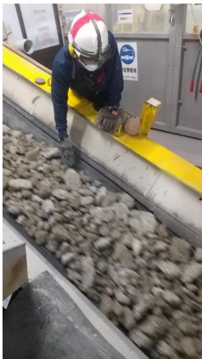
現状の手作業工程の様子①

社会インフラとして人々の暮らしを支えている道路や建物は、改修および解体時に発生するがれき類のほとんどがリサイクルされています。そして中間処理施設における選別作業は、再生製品の品質確保や選別後廃棄物の有効利用など、リサイクル事業において不可欠であり、重要な工程の一つです。現状、製品としてリサイクルできない不純物(金属や木くず等の夾雑物)の一部は、粉塵や騒音などが発生する過酷な作業環境の中、手作業で取り除いており、労働力不足と作業安全性の確保が大きな課題となっています。