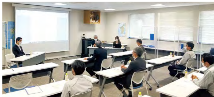
コンプライアンス研修の様子

また、今年度は、昨年度に引き続き、「法務コンプライアンス部」および「監査部」を中心に、一連の独占禁止法違反事件を受けて策定した再発防止策に関するフォローを重点的に行い、関係各部門と連携することにより、再発防止策のさらなる徹底を図っています。